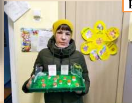
Грибы: ядовитые, съедобные