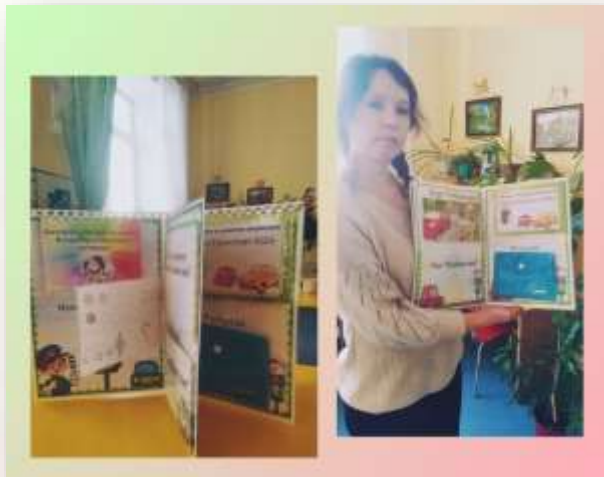
Разработка лэпбука по ПДД