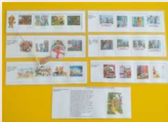
Настольно – печатная игра «Причины возникновения пожара»