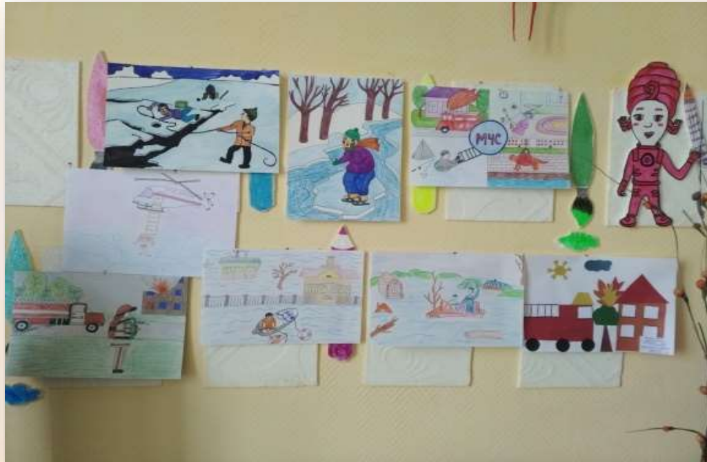
Выставка творческих работ «МЧС спешит на помощь»