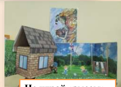
Не играй «змеем» рядом с проводами