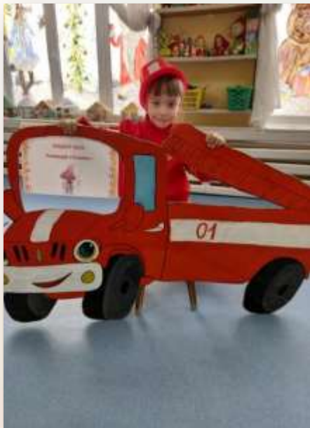
Фото - квест «Вектор безопасности»