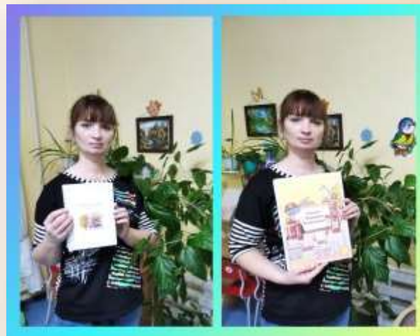
Сборник по сказкам «Правила дорожного движения», книжка – малышка по пожарной безопасности