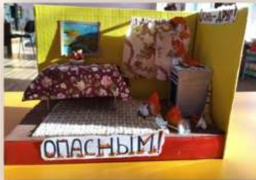
Не играй со спичками