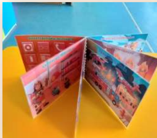
Лэпбук по пожарной безопасности