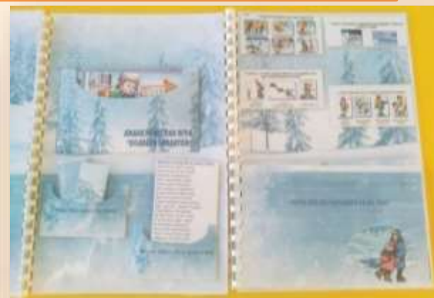
Лэпбук «Безопасное поведение на водных объектах в зимний период»