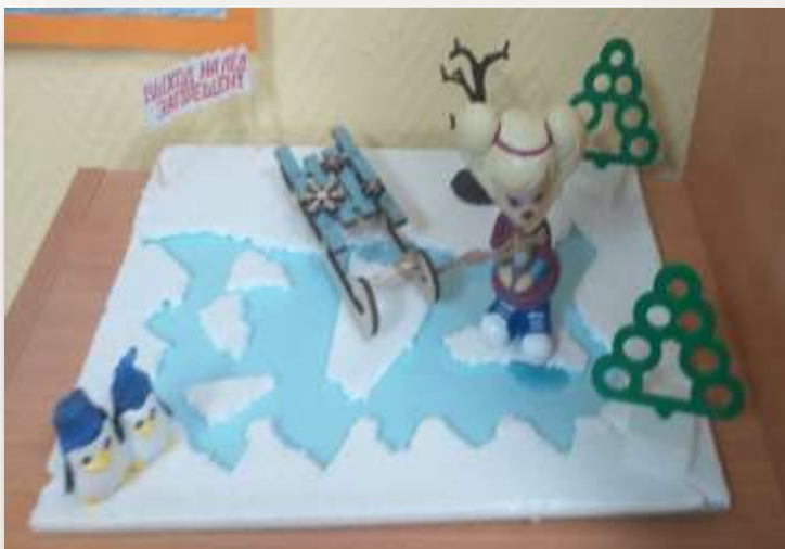
Макет «Осторожно, тонкий лёд»