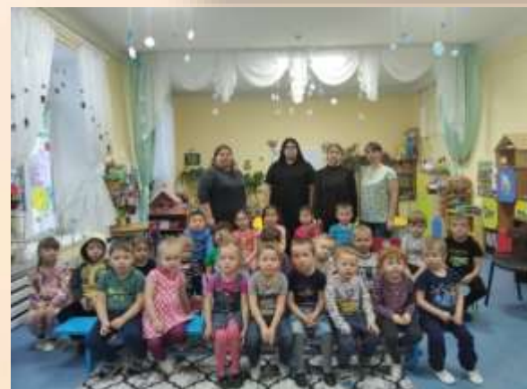
Акция «День памяти жертв ДТП»